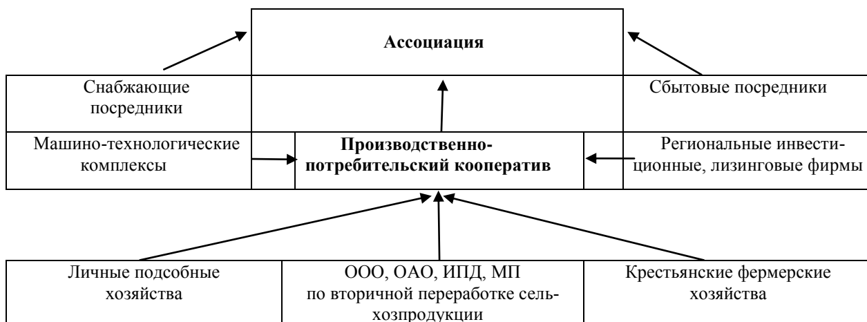
Рис. 2. Схема взаимодействия субъектов АПК, объединённых в состав единой компании

Кооператив не ущемляет их права на собственность, сохраняются их права на владение – пользование – распоряжение землей и одновременно расширяются возможности совместной обработки разрозненных участков земли – это своего рода товарищество по совместной обработке земли.