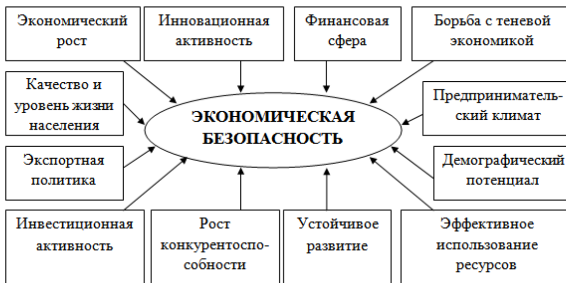
Рис. 1. Факторы обеспечения экономической безопасности страны

а системный характер, что требует от каждой национальной экономики, и современная Россия не является исключением, системной защиты экономической безопасности и комплексного подхода в анализе факторов экономической безопасности страны (рис. 1).