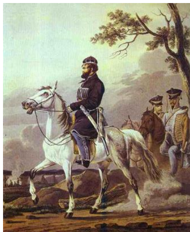
Орловский А.О. Портрет Дениса Давыдова. 1814 г.

Изображению этих событий присуща особая эпичность, уходящая корнями в древнерусское искусство и в то же время выражающая возвышенные чувства современников. Особое внимание можно уделить портретам замечательного русского художника А. Орловского. Героями его произведений стали не только военачальники (М. Кутузов, Д.В. Давыдов и др.) Изображение русской армии у него связывалось с любимой темой его творчества – изображением солдатской и походной жизни.