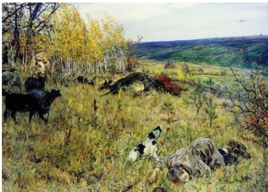
Пластов А.А. Фашист пролетел. 1942 г.

Произведения искусства посвященные теме Великой Отечественной войны, отличаются широтой охвата явлений этого исторического периода, многообразием образов. Одним из примеров служит живописное полотно уроженца г. Симбирска – А.А. Пластова «Фашист пролетел».