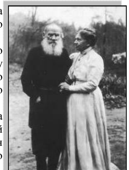
Лев Толстой и Софья Андреевна

Тайно оставленное завещание лежало у Толстого на совести. Все время он находился между не вполне нормальной женою и ее противниками (Чертков и сотоварищи). Он изнемогал, он задыхался. Он предчувствовал свою близкую смерть. Ему стало неудержимо хотеться уйти из этого «дома сумасшедших», зараженного ненавистью и борьбою. Ему стало неудержимо хотеться умереть в спокойной обстановке, вдали от людей, «разменявших его на рубли».