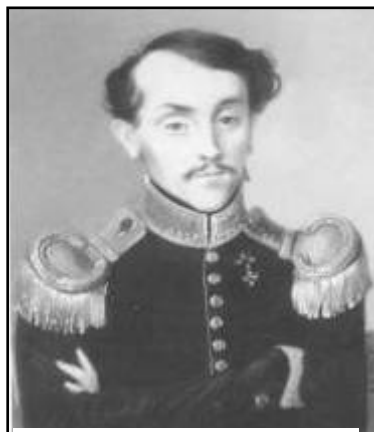
Николай Ильич Толстой

В Толстом слилась кровь самых родовитых русских семейств Волконских, Голицыных, Трубецких.