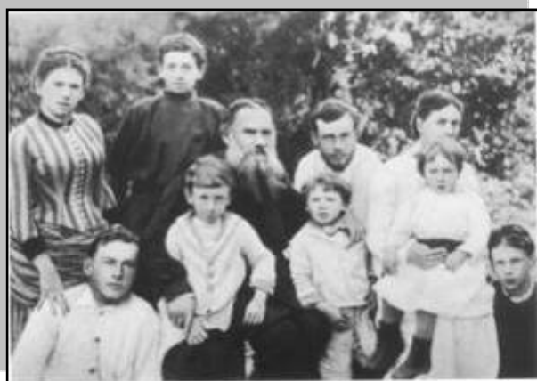
Лев Толстой в кругу семьи

Детей своих жалел, беседовал, затрагивая серьезные деликатные темы, а когда они выросли, часто спорил, но никогда не приказывал и не навязывал своих мнений. Толстой считал воспитание процессом бесконечным и не оставлял без наставлений и советов уже выросших и повзрослевших, со сложившимися жизненными правилами и привычками детей: чем взрослее они