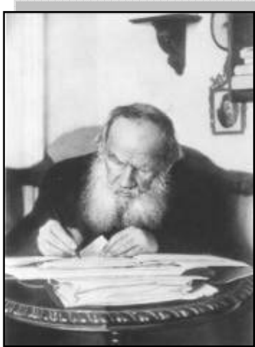
Лев Толстой за работой

В 1901 году Толстой заболевает малярией и в связи с болезнью отправляется в Крым. В Крыму ему легче не становится. Он постоянно болел. И был так плох, что никто в близкой смерти Толстого не сомневался. Решили погребение совершить в Крыму, для чего уже был куплен небольшой участок земли. Но он выкарабкался и удивил всех. Вернувшись, Толстой до драматического ухода осенью 1910 года оседет в Ясной Поляне.