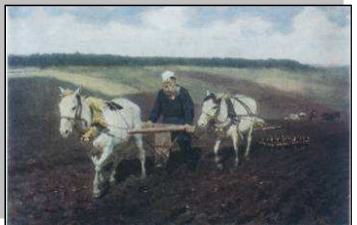
Лев Толстой на пашне. Худ. И.Репин

«Из 13 детей, которых она родила, она 11 вскормила «собственной грудью». Из первых 13 лет замужней жизни, она была беременна 117 месяцев, т. е. 10 лет и кормила грудью больше 13 лет и в то же время успевала вести все сложное хозяйство большой семьи, и по 8, 10, а иногда и 20 раз переписывать литературные труды Толстого».