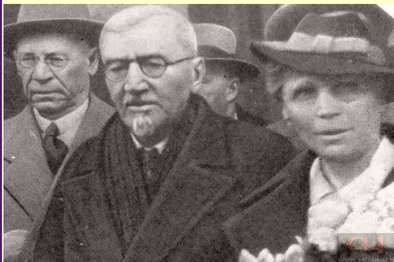
Куприн, возвращение на родину

Москвы от литературы, после того как писатель эмигрировал, утверждали, что в произведениях Куприна нет «женщин-общественниц», зато мастерски выписаны «пленительные самки». В конце концов дело дошло до того, что по распоряжению заместителя наркома просвещения Н.К.