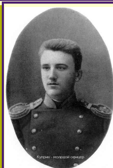
Куприн - молодой офицер

решает поступить в Академию Генерального штаба и отправляется в Петербург. Но судьба была к нему неблагосклонна. По дороге в столицу в Киеве, он ввязывается в дурацкую историю. В плавучем ресторане у молодого Куприна происходит ссора с полицейским приставом. Недолго думая, он, неплохой борец и гиревик, перебрасывает пристава через перила прямо в Днепр. Когда почти все экзамены были успешно сданы, жалоба обиженного пристава достигла столицы, и подпоручику Куприну запретили поступать в академию в течение пяти лет. Оскорбленный, он, вернувшись в часть, не дослужив и года - подал в отставку и остался в двадцать три года без копейки, без крыши над головой и без какой-либо серьезной специальности.