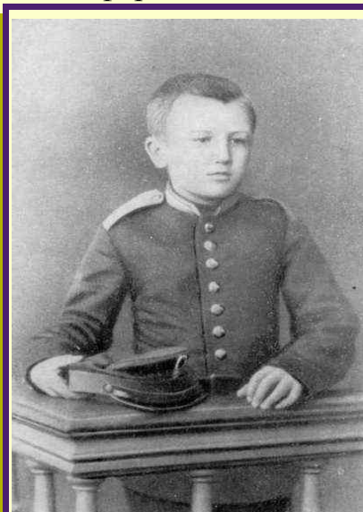
А. Куприн, кадет