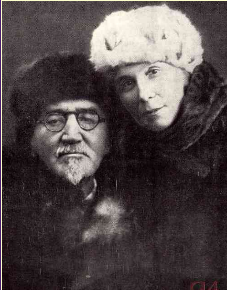
Последнее фото с женой